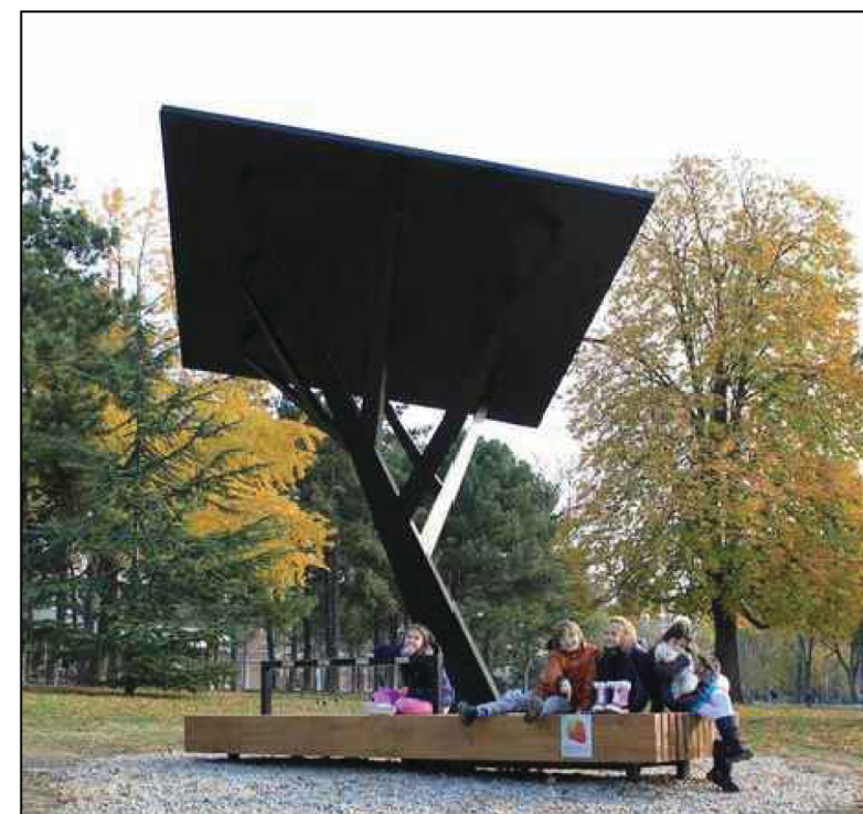
(C) místa setkávání