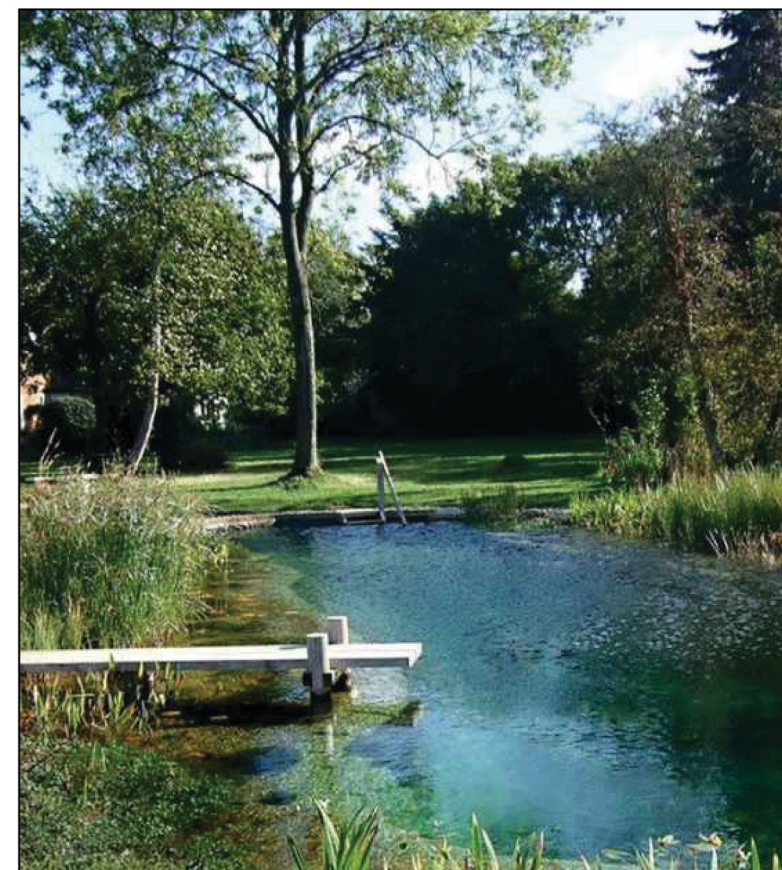
(A) vodní prvky